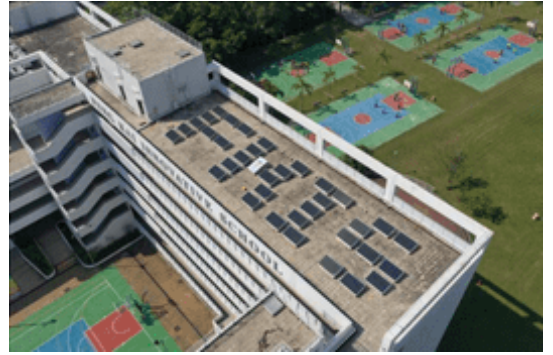
「採電學社」計劃下安裝的太陽能發電系統