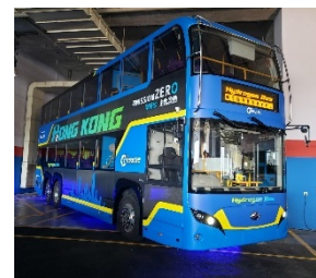
香港首輛雙層氫燃料電池巴士