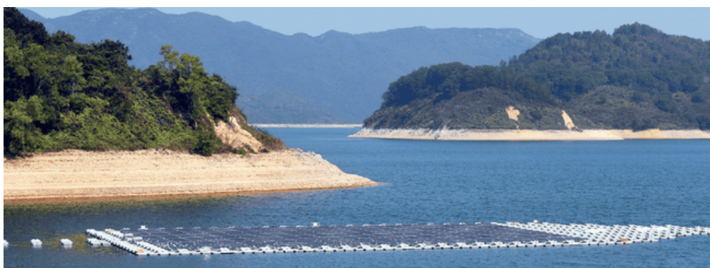
位於船灣淡水湖的浮動太陽能發電系統