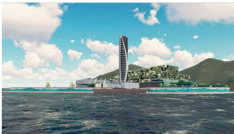
I-PARK 綜合廢物管理設施第一期 構思圖